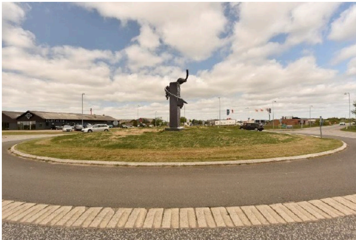
Figur 3 - Skulptur, der ønskes opsat i rundkørslen ved Vejlevej

Skulpturen, der ønskes opsat i rundkørslen på Vejlevej, er ligeledes opbygget omkring en granitsøjle, men med en mere dynamisk komposition. Rotary beskriver, at skulpturen forestiller et kraftigt tov, der snor sig opad i en spiral, hvor tre figurer bevæger sig op og ud i rummet. Dette skal være et billede på energi, udvikling og visioner. Værket vil blive placeret på en lav, beplantet høj med lyng, som er en plante med stærk tilknytning til hedelandskabet, og som ikke vil skygge for skulpturen. Skulpturen, der ønskes opsat i rundkørslen ved Vejlevej er vist på nedenstående billede.