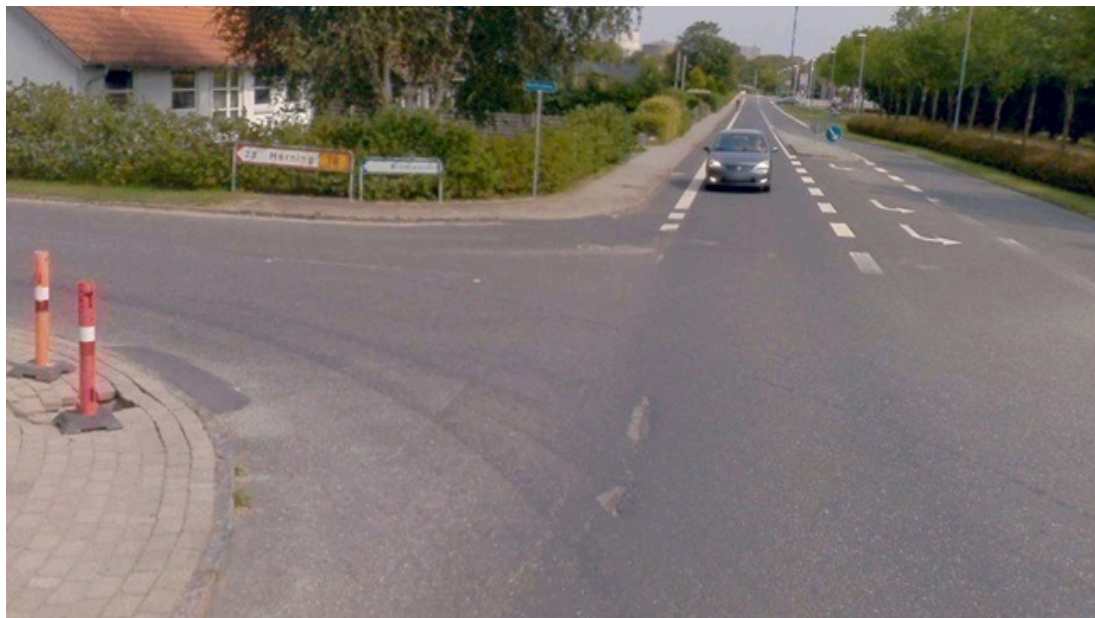
Figur 2: Vejvisning med pilevejviser mod Herning i krydset Brandlundvej/Nordlundvej, Brande

Der er i dag opsat almindelige pilevejvisere på Brandlundvej som vejviser mod Herning ad Nordlundvej. Tilsvarende er der på Herningvej opsat en pilevejviser ved Ny Sandfeldvej, som vejviser mod Sdr. Omme.