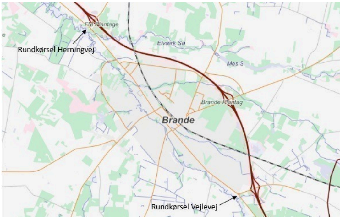
Figur 1 - Rundkørsler ved Herningvej og Vejlevej