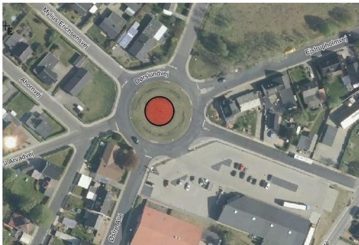
Figur 2 - Areal til placering af kunstværker i midterøen

Rotary har oprindeligt ansøgt om at opsætte kunstværkerne i den yderste del af rundkørslen, så de står ca. 4,5 m fra kørebane kanten. Teknik og Miljø vurderer, at kunstværkerne bør flyttes ind i den centrale del af rundkørslen, som vist på nedenstående kort.