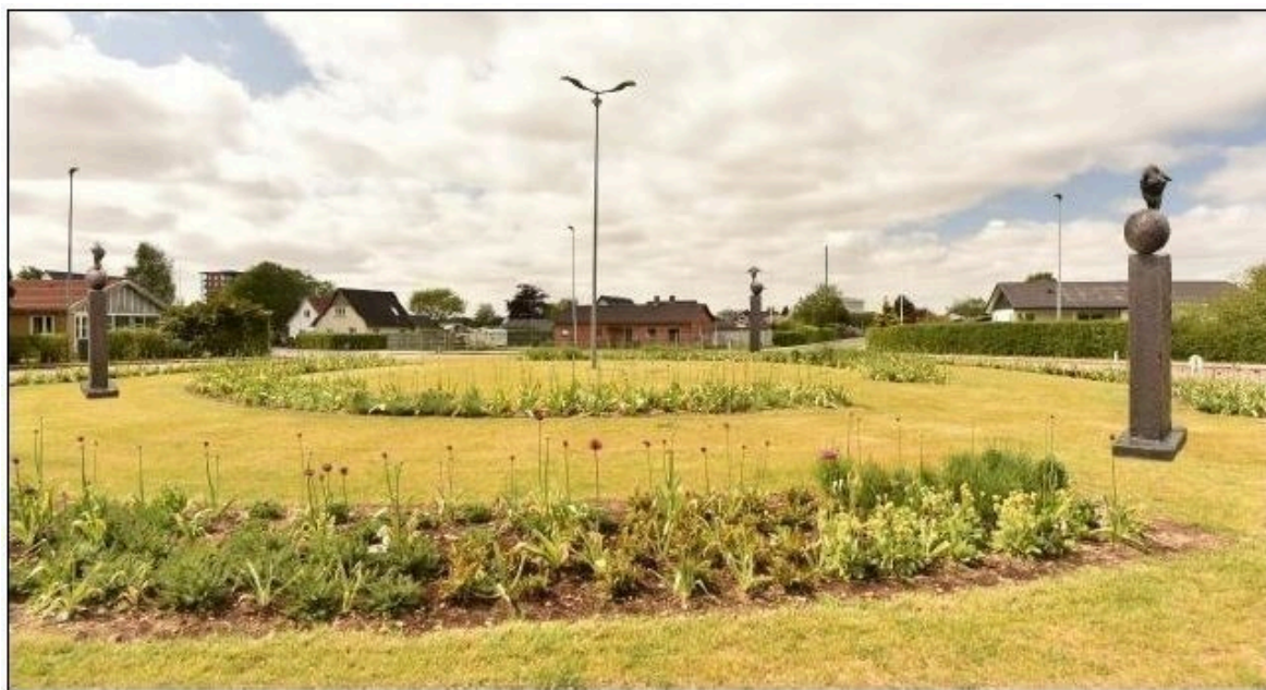
Figur 1 - Illustration af kunstværker og ansøgt placering

Teknik og Miljø har i 2023 modtaget en ansøgning fra Rotary i Brande, som ønsker at opsætte kunstværker i midterøen til rundkørslen ved Østre Allé i Brande. Kunstværkerne består af tre skulpturer placeret på granitsøjler, og er lavet af den afdøde kunster Keld Moseholm. Skulpturerne er udført i bronze og granit.