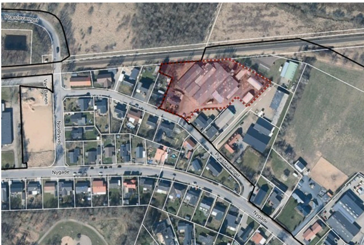
Figur 2 viser afgrænsningen af området ved Præstevænget 109-111, der skal omfattes af den nye lokalplan. Nord er opad.

Yderligere kortmateriale og illustrationer kan ses i debatoplægget, der er vedlagt som bilag.