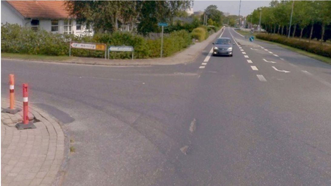
Figur 2: Vejvisning med pilevejviser mod Herning i krydset Brandlundvej/Nordlundvej, Brande

Teknik og Miljø har ved hjælp af GPS-data undersøgt hvordan trafikken, der kører mellem Brandlundvej og Herningvej fordeler sig. Der er brugt GPS-data fra både personbiler og lastbiler i perioden 1.1.2025 – 1.11.2025.