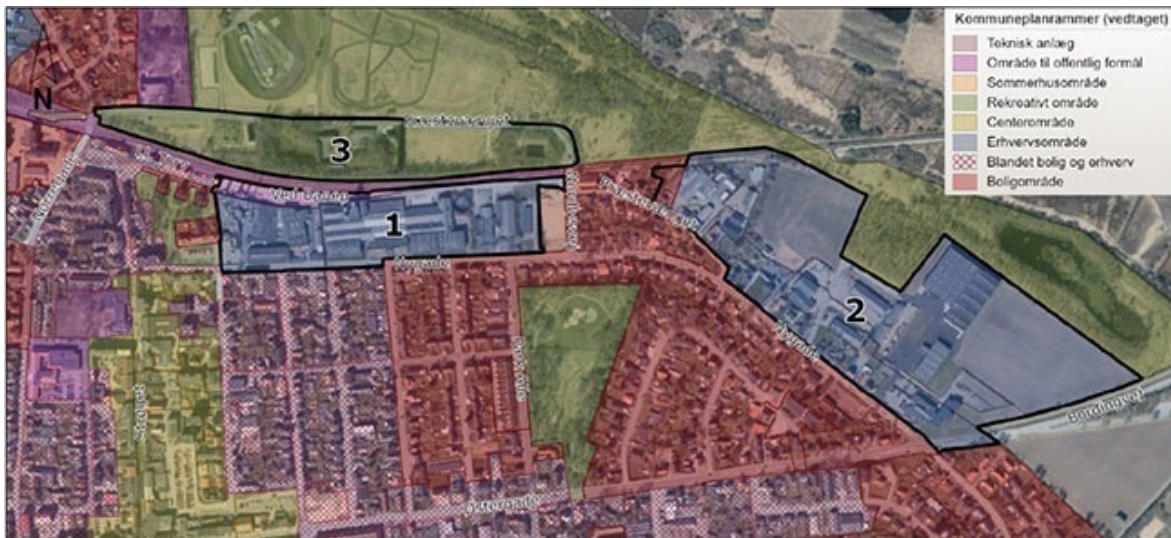
Figur 1 viser de gældende kommuneplanrammer og planområder 1, 2 og 3, som omfattes af ændringer i kommuneplantillæg nr. 9. Nord er opad.