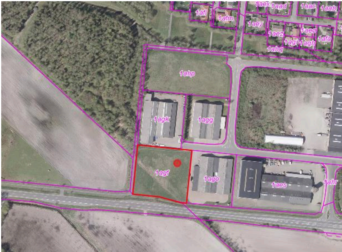
Kortet viser med rødt, Fabriksvej 23, Bording som sælges.