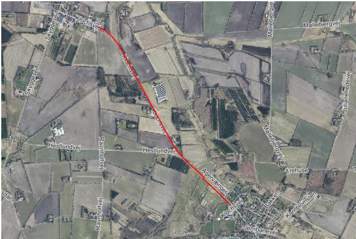
Figur 1: Multisti mellem Bording Hallen og kirken i Bording Kirkeby

Planen var oprindeligt, at Multistilaugets selv skulle finde den resterende finansiering til projektet via fonde og lignende, og de skulle også selv stå for alt arbejde, der er forbundet med multistien, herunder projektering, aftaler vedr. arealafståelse, udførelse, fremtidig drift, osv.