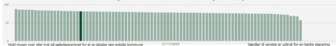
Andel fleksjobvisiterede som har fået et fleksjob i 2023, pct.

Ikast-Brande Kommune opnår gode resultater i forhold til at få fleksjobvisiterede borgere i fleksjob. I 2023 placerede kommunen sig som nummer 21, med 81,43 procent af de fleksjobvisiterede borgere i fleksjob. Til sammenligning lå mediankommunen på 77,8 procent.