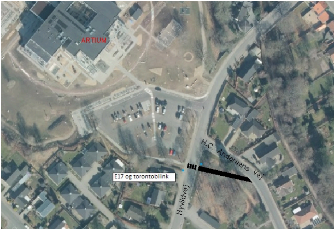
Figur 1: Fodgængerovergang på Hyvildvej og sti til H.C. Andersens Vej

Arealet mellem Hyvildvej og H.C. Andersens Vej, hvor stien ønskes etableret, er på nuværende tidspunkt ikke ejet af Ikast-Brande Kommune. Det betyder derfor, at det vil være nødvendigt at erhverve en del af den matrikel, hvorpå stien skal etableres.