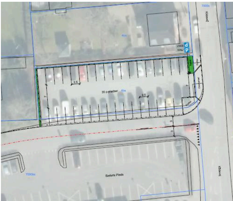
Indretning af P-plads ved Kildevej - med udvidelse

Da pladserne på grusarealet i dag ikke er afmærket, holder der væsentlig flere på arealet i dag, og Teknik og Miljø har derfor udarbejdet et skitseprojekt, der omfatter asfaltering og opstregning af 35 P-båse. For at gennemføre dette projekt er det nødvendigt, at flytte kantstenen ud mod Sieferts Plads og derved sikre plads til, at afmærkede P-båse lever op til de krav om størrelse og manøvreareal, der stilles i gældende vejregler. Indsnævring af vejstrækningen mellem grusparkeringspladsen og parkeringspladsen mod syd, vurderes ikke at give trafikale udfordringer. Udformningen fremgår af nedenstående skitse.