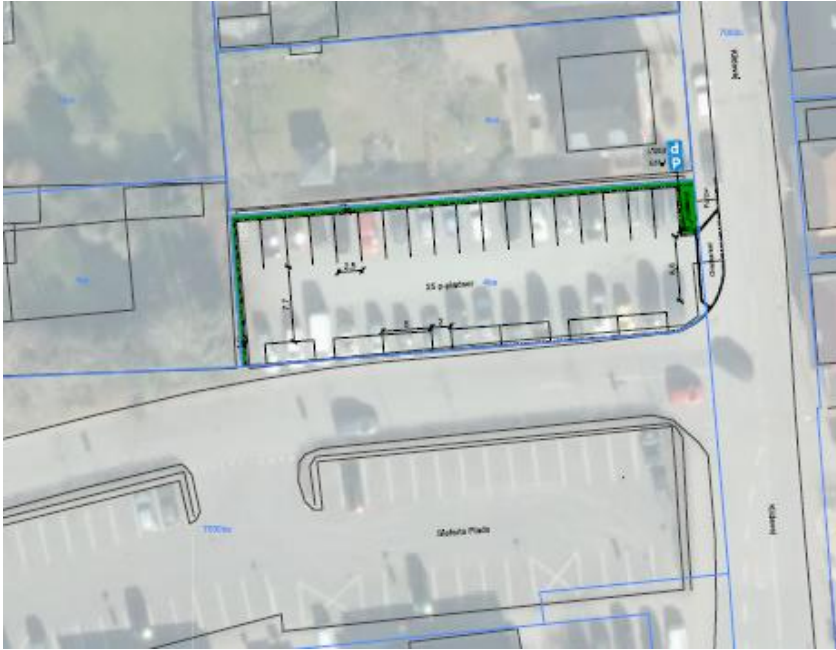
Indretning af P-plads ved Kildevej - uden udvidelse

Da pladserne på grusarealet i dag ikke er afmærket, holder der væsentlig flere på arealet i dag, og Teknik og Miljø har derfor udarbejdet et skitseprojekt, der omfatter asfaltering og opstregning af 35 P-båse. For at gennemføre dette projekt er det nødvendigt, at flytte kantstenen ud mod Sieferts Plads og derved sikre plads til, at afmærkede P-båse lever op til de krav om størrelse og manøvreareal, der stilles i gældende vejregler. Indsnævring af vejstrækningen mellem grusparkeringspladsen og parkeringspladsen mod syd, vurderes ikke at give trafikale udfordringer. Udformningen fremgår af nedenstående skitse.