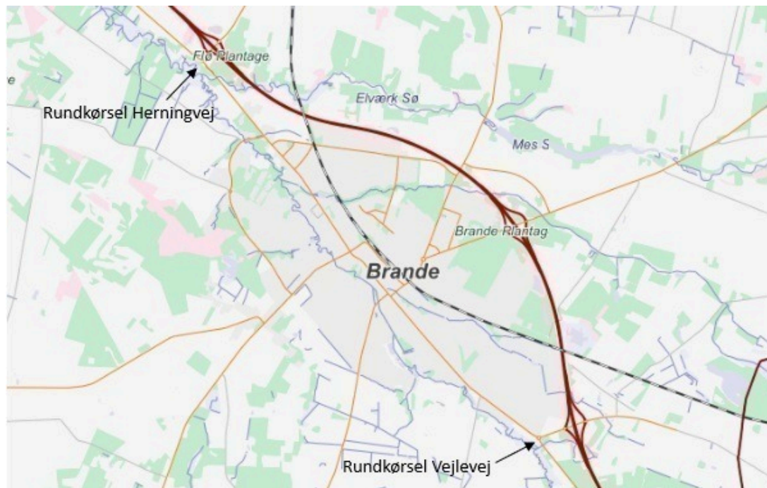
Figur 1 - Rundkørsler ved Herningvej og Vejlevej

Teknik og Miljø har modtaget en ansøgning fra Rotary i Brande om opsætning af kunstværker i de to rundkørsler ved henholdsvis Herningvej og Vejlevej i Brande.