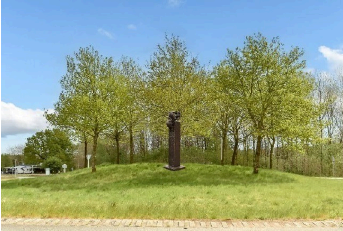
Figur 2 - Skulptur, der ønskes opsat i rundkørsel ved Herningvej

Skulpturen, der ønskes opsat i rundkørslen på Vejlevej, er ligeledes opbygget omkring en granitsøjle, men med en mere dynamisk komposition. Rotary beskriver, at skulpturen forestiller et kraftigt tov, der snor sig opad i en spiral, hvor tre figurer bevæger sig op og ud i rummet. Dette skal være et billede på energi, udvikling og visioner. Værket vil blive placeret på en lav, beplantet høj med lyng, som er en plante med stærk tilknytning til hedelandskabet, og som ikke vil skygge for skulpturen. Skulpturen, der ønskes opsat i rundkørslen ved Vejlevej er vist på nedenstående billede.