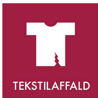
Piktogram for tekstilaffald.

Alle modeller kræver en informationskampagne i forbindelse med opstart af indsamlingsordningen, hvor der én gang kan omdeles røde poser til tekstilaffald, ligesom forskellen mellem tekstilaffald og tekstil til direkte genbrug skal formidles.