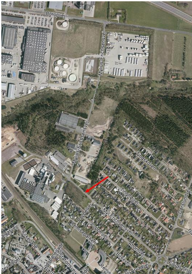
Figur 2 – Oversigtskort Myl. Erichsens Vej

Mange lastbilchauffører, der kører efter GPS bliver ledt ad boligdelen på Myl. Erichsens Vej. De er ikke opmærksomme på skiltet i rundkørslen, hvor der står, at der kun er 2,1 m. bredt, hvis de fortsætter ad Myl. Erichsens Vej. Det betyder derfor, at de f.eks. vender på Poppelvej eller bakker tilbage i rundkørslen, hvilket kan give nogle farlige situationer.