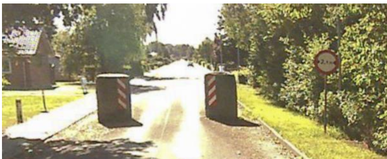
Figur 1 – Billede af granitsøjler

Som det er i dag, er Myl. Erichsens Vej overordnet set opdelt i en boligdel og erhvervsdel. Erhvervsdelen har adgang via Borupvej, mens boligdelen har adgang fra rundkørslen ved Dørslundvej. Imellem de to dele er der opsat store granitsøjler med en afstand på 2,1 m. i mellem. Det betyder, at personbiler og lette trafikanter godt kan køre igennem, men lastbiler og andre større køretøjer ikke kan.