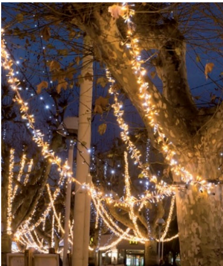
Eksempel på Clusterlight.