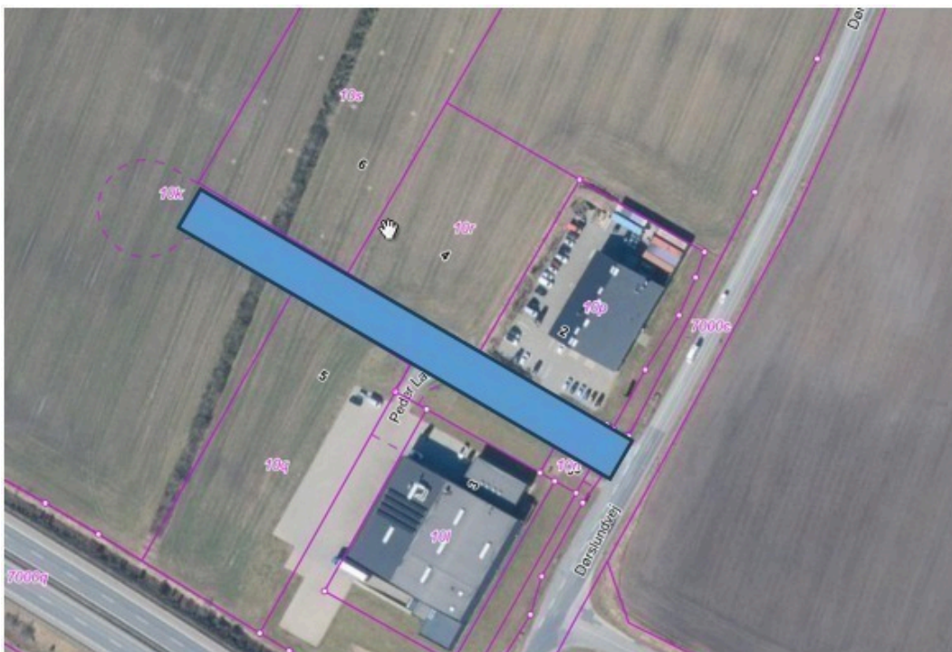
Kort over området ved Peder Larsens vej, Brande

Ikast-Brande Kommune har i forbindelse med salg af erhvervsgrunde på Peder Larsen Vej, Brande forlænget vejen, så der nu er ca. 200 m anlagt vej med en kørebanebredde på ca. 6 m. Peder Larsens Vej er en sidevej tilsluttet den eksisterende offentlige vej Dørslundvej. Vejstykket ønskes optaget som offentlig vej. Plan for området er vedtaget i Lokalplan 12.4 - Erhverv Nordøst for Brande - Område A. Vejen ses angivet med blå på det indsatte kort.