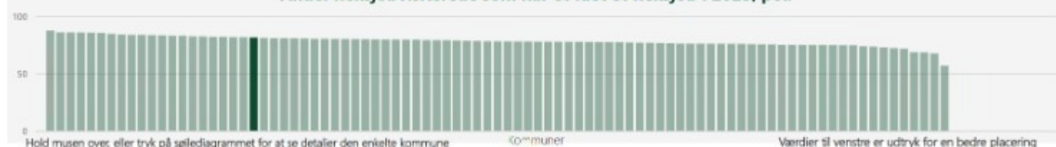
Andel fleksjobvisiterede som har fået et fleksjob i 2023, pct.

Ikast-Brande Kommune opnår gode resultater i forhold til at få fleksjobvisiterede borgere i fleksjob. I 2023 placerede kommunen sig som nummer 21, med 81,43 procent af de fleksjobvisiterede borgere i fleksjob. Til sammenligning lå mediankommunen på 77,8 procent.