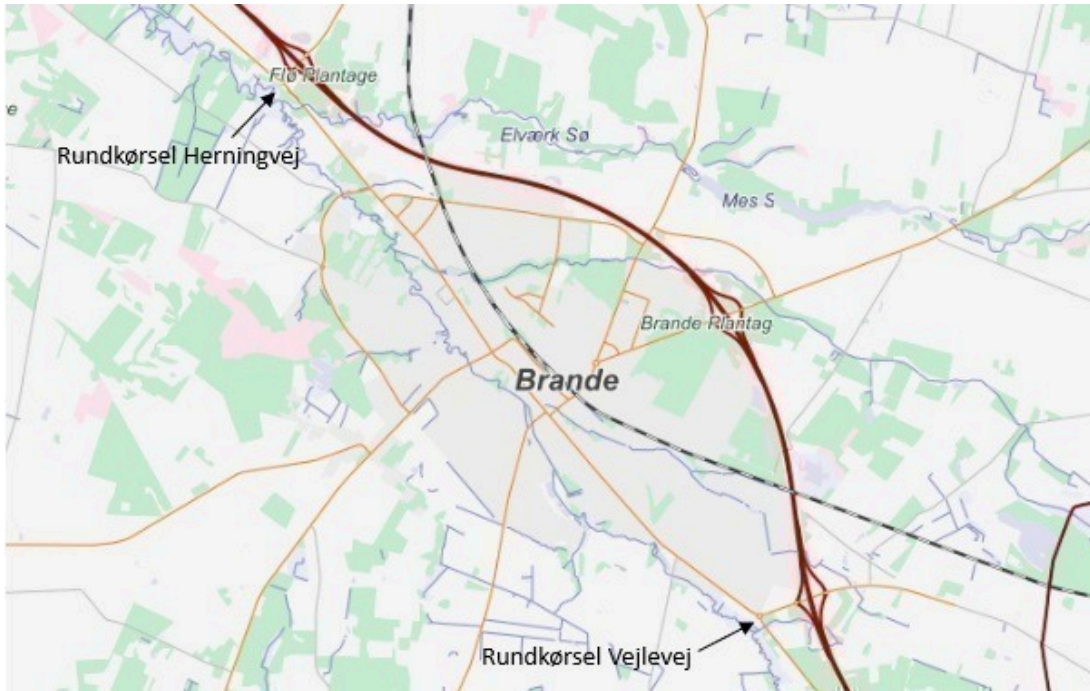
Figur 1 - Rundkørsler ved Herningvej og Vejlevej