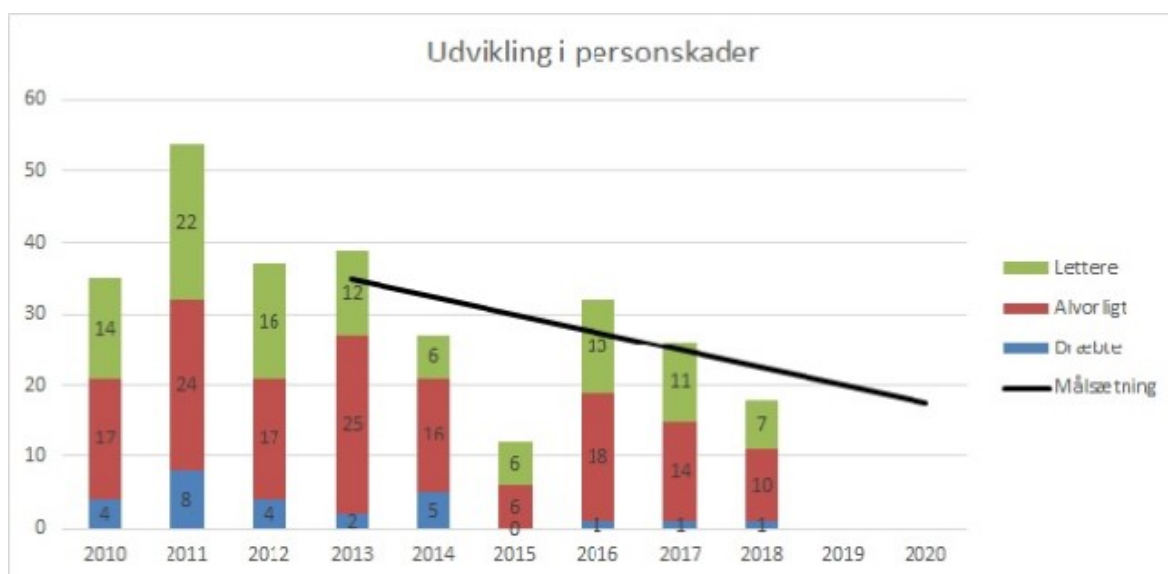
Figur 2 - Udvikling i personskader 2010-2020.

Udviklingen i personskader siden 2010 ses på figuren herunder.