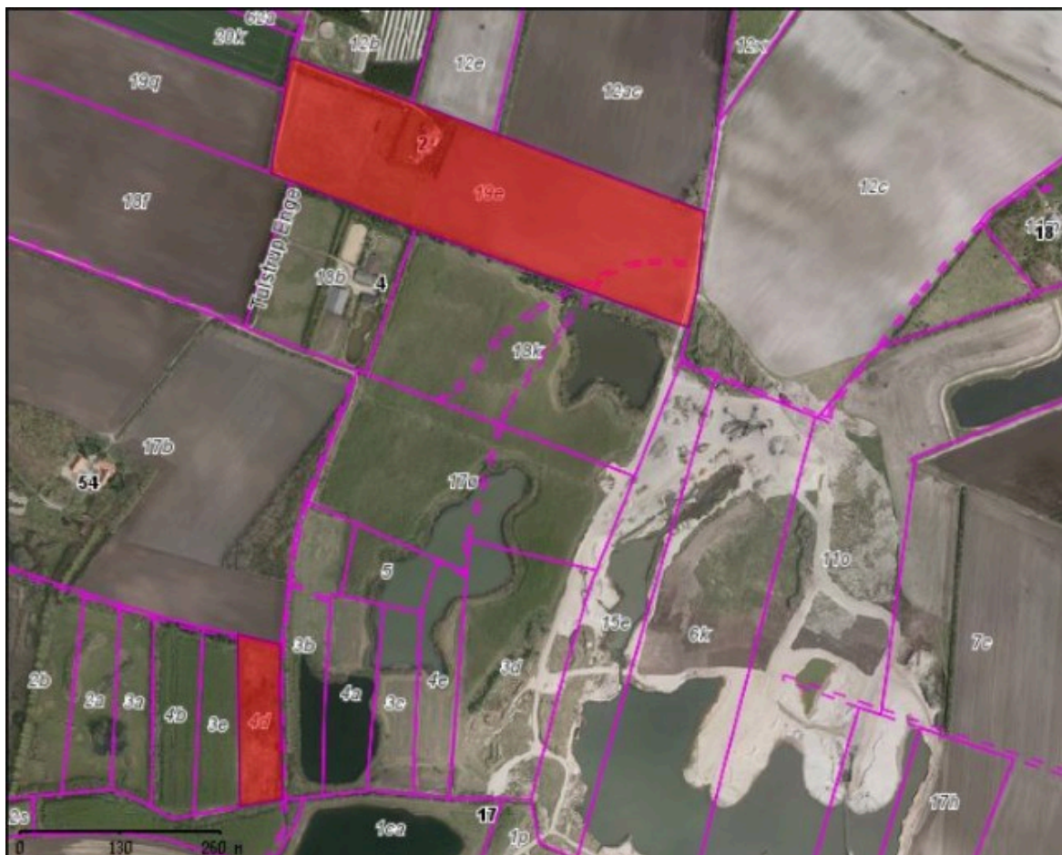
Kort 2, Tulstrup Enge 2 og deres Engparcel

Spørgsmålet om vejs nedlæggelse har nu været i høring hos Tulstrup Enge 2 og på kommunens hjemmeside. Der er kommet en indsigelse fra Tulstrup Enge 2, der mener, at vejen er af vigtighed for ejendommen, da de ellers vil få længere ned til deres engparcel, vist på kort 2. Det er en rute på 1100 meter kontra en rute på 700 meter, altså en forskel på 400 meter.