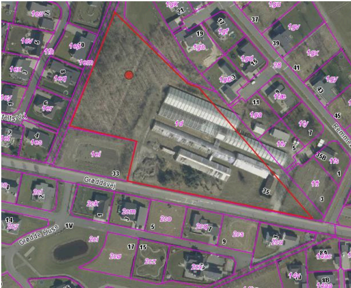
Kortet viser med rød den storparcel, der kan udbydes til salg.