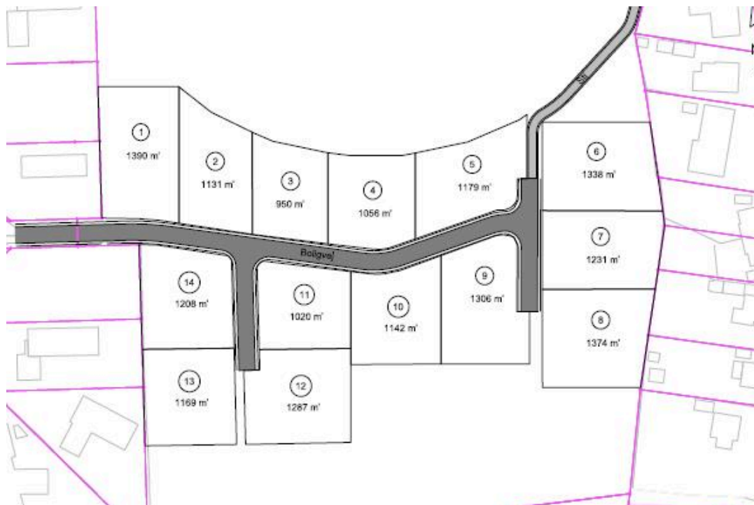
Udstykningsplan for Kildebakken.

* Jorden er ejet af Ikast-Brande Kommune og har været det i mange år. Jordens medtagne værdi svarer til værdien af landbrugsjord, idet udgiften til udgravning af fortidsminder ikke indgår som en byggemodningsudgift.