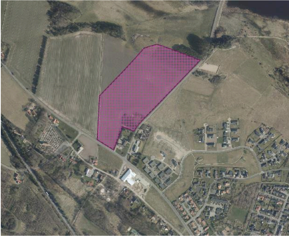
Kortet viser med skravering det lokalplanlagte areal.