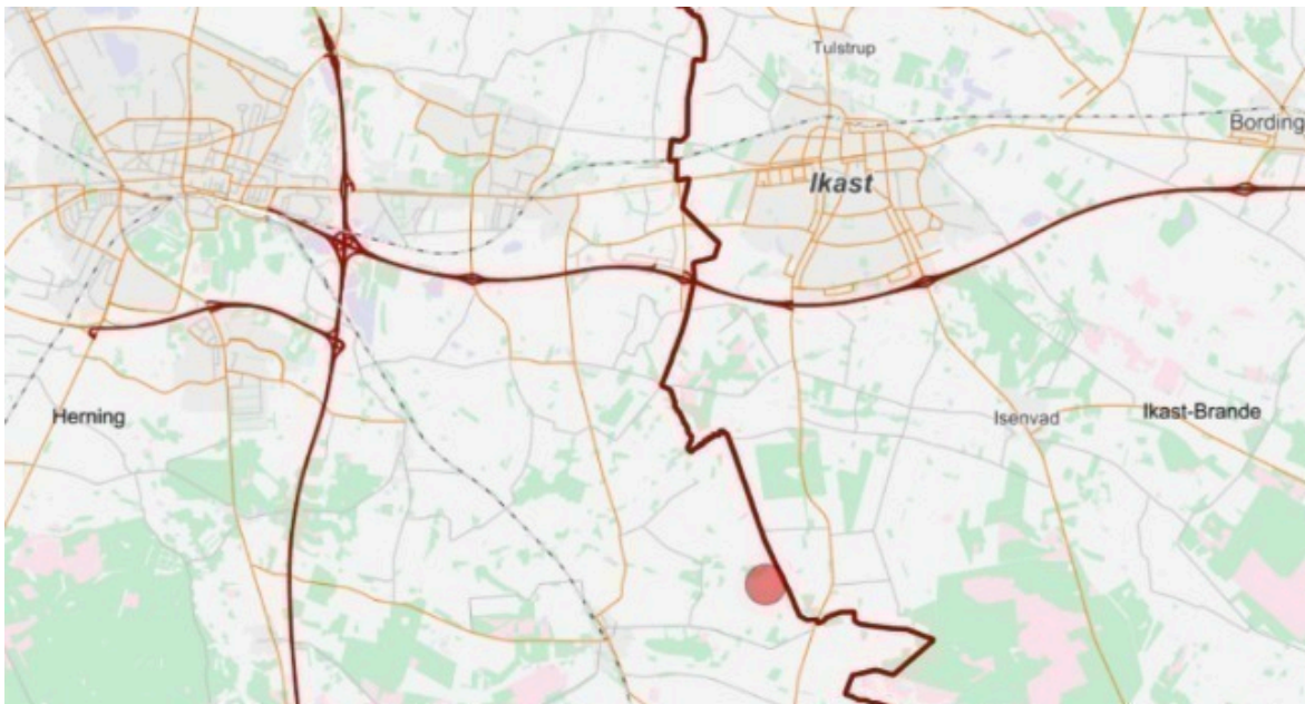
Figur 1. Undersøgelsesområdet for lavbundsprojektet Uldgrå Mose er markeret med en rød cirkel. Kommunegrænsen er markeret med rød streg.

Herning Kommune har sammen med Ikast-Brande Kommune igangsat en forundersøgelse af et muligt lavbundsprojekt ved Uldgrå Mose for at reducere udledningen af klimagasser. Undersøgelsesområdet er beliggende ved Lille Nørlund Bæk og Låsevase Bæk, der er en del af Fjederholt/Rind Å-systemet, som afvander til Ringkøbing Fjord. Området ses på nedenstående kortudsnit