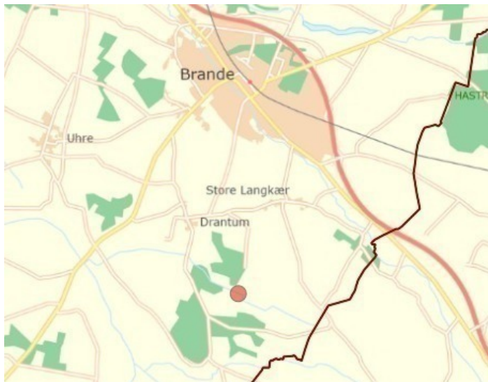
Figur 1. Placering af lavbundsprojekt ved Pilkmosen.

Ikast-Brande Kommune har igangsat et lavbundsprojekt ved Pilkmosen for at reducere udledningen af henholdsvis kvælstof til vandmiljøet og klimagasser til atmosfæren. Området ses på nedenstående kortudsnit.