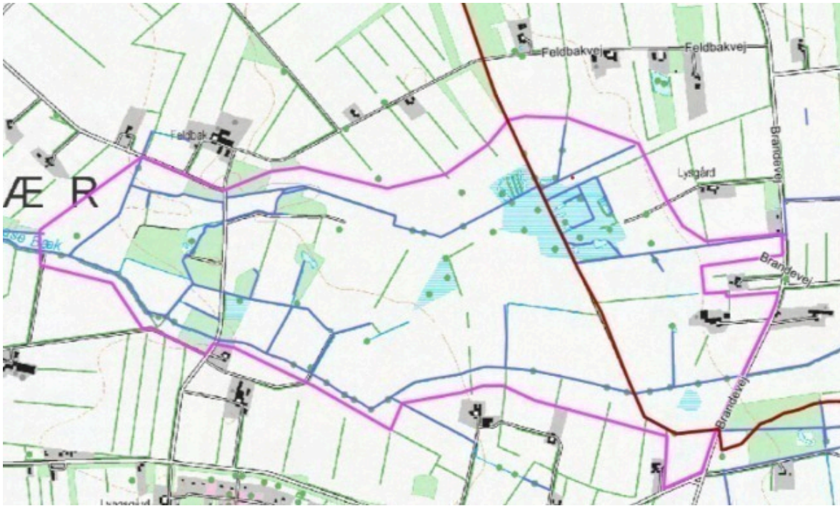
Figur 2. Undersøgelsesområdet for lavbundsprojektet Uldgrå Mose er markeret med pink streg. Kommunegrænsen er markeret med rød streg, hvor Herning Kommune ligger mod vest og Ikast-Brande Kommune mod øst.

Herning Kommune er projektejer, da hovedparten af projektet ligger i Herning Kommune. Herning Kommune har ansøgt og opnået tilsagn fra Styrelsen for Grøn Arealomlægning og Vandmiljø om tilskud til en forundersøgelse. Herning Kommune har som projektejer ansvaret for økonomien og forvalter tilsagnet. Ikast-Brande Kommune bliver kompenseret for de arbejdstimer, som Ikast-Brande Kommunes medarbejdere bruger på projektet. Kompensationen forventes udbetalt til Ikast-Brande Kommune umiddelbart inden projektets afslutning, som skal ske senest i oktober 2027.