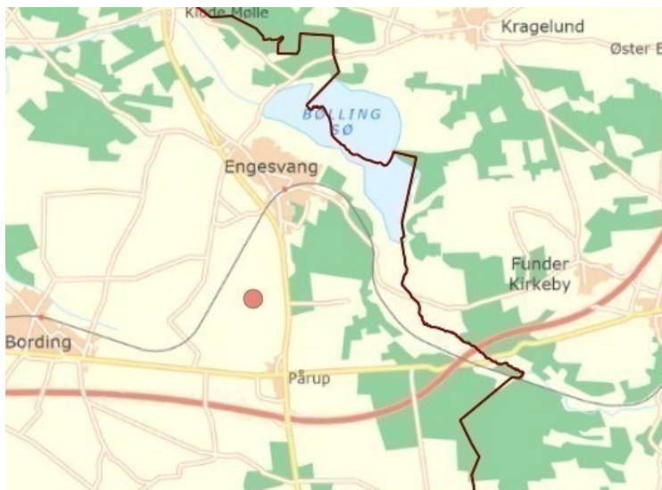
Figur 1. Placeringen af lavbundsprojekt ved Pårup Mose.

Ikast-Brande Kommune har igangsat et lavbundsprojekt ved Pårup Mose for at reducere udledningen af henholdsvis kvælstof til vandmiljøet og klimagasser til atmosfæren. Området ses på nedenstående kortudsnit.