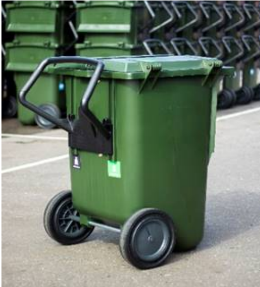
Foto af AVK's dansk producerede affaldsbeholder, til genanvendeligt affald.

Farven på beholderne vil afvige fra den på foto.